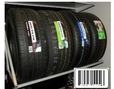
Przechowalnia opon, Baza kodów kreskowych